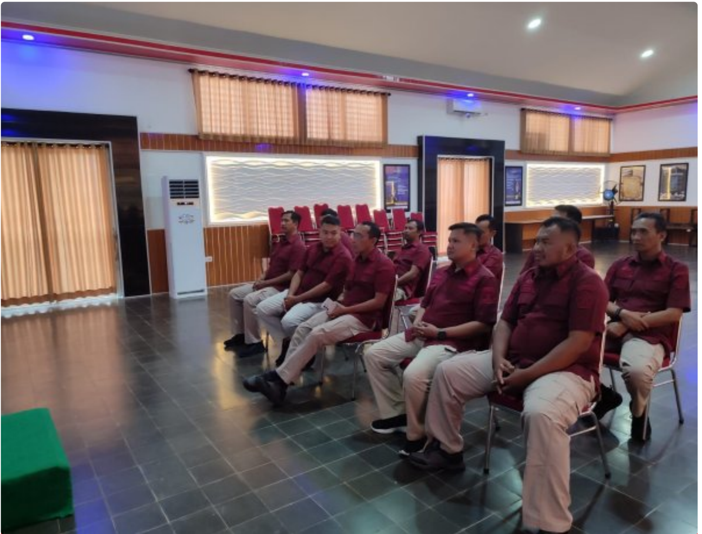
Bangun Personal Branding ASN, Lapas Besi Hadiri Webinar Series 6

CILACAP – Petugas Lapas Kelas IIA Besi Nusakambangan menghadiri kegiatan Webinar Series 6 yang diselenggarakan oleh Badan Pengembangan Sumber Daya Hukum (BPSDM) dan HAM bertempat di Aula Wijaya Kusuma, Kamis (24/10/2024).